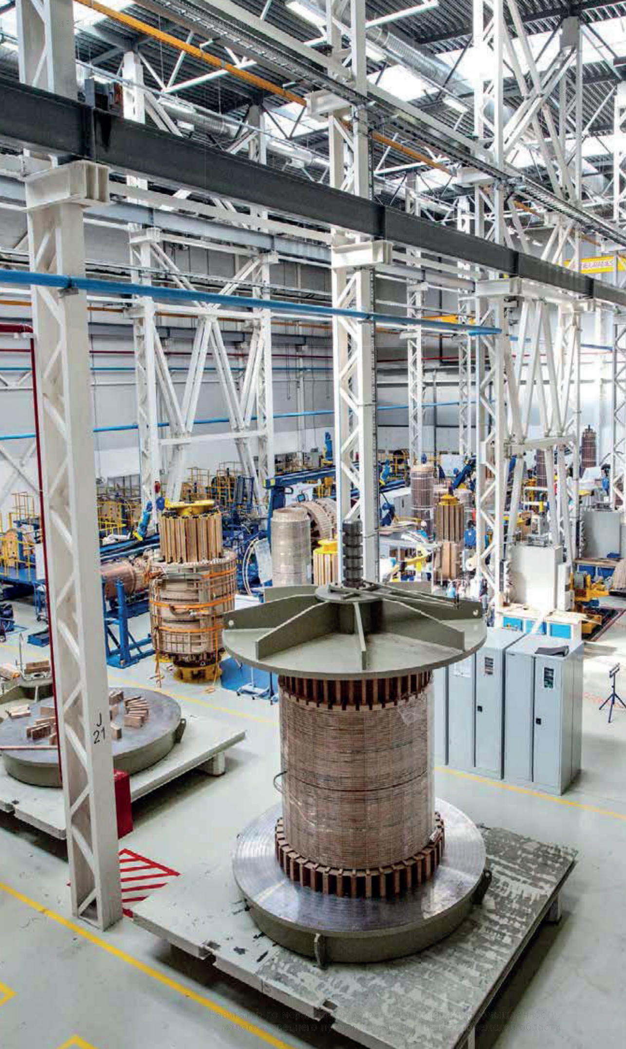
Види на го мерила на големина на статорот на електрична машина, изградена во рамките на средното професионално образование во Скопје, Република Македонија